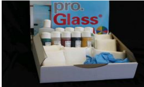
pro.Glass® Color Professional Box