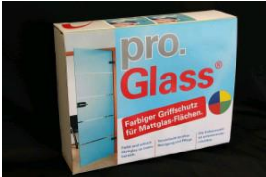
pro.Glass® Color Professional Box